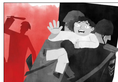
Illustrator: Klara Nordin Stensjö