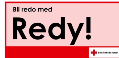
Illustration: Röda Korset

Snart är det dags att lansera nya Redy – ett nytt och sammanhållet administrationsverktyg för kretsar, där allt finns på ett och samma ställe. Nya Redy är grunden i ett erbjudande av digitala verktyg och blir en sammanslagning av gamla Redy och det tidigare verktyget Frivillig. I stället för två olika system blir det nu ett gemensamt där vi kan administrera våra verksamheter, frivilliga, medlemmar med mera.