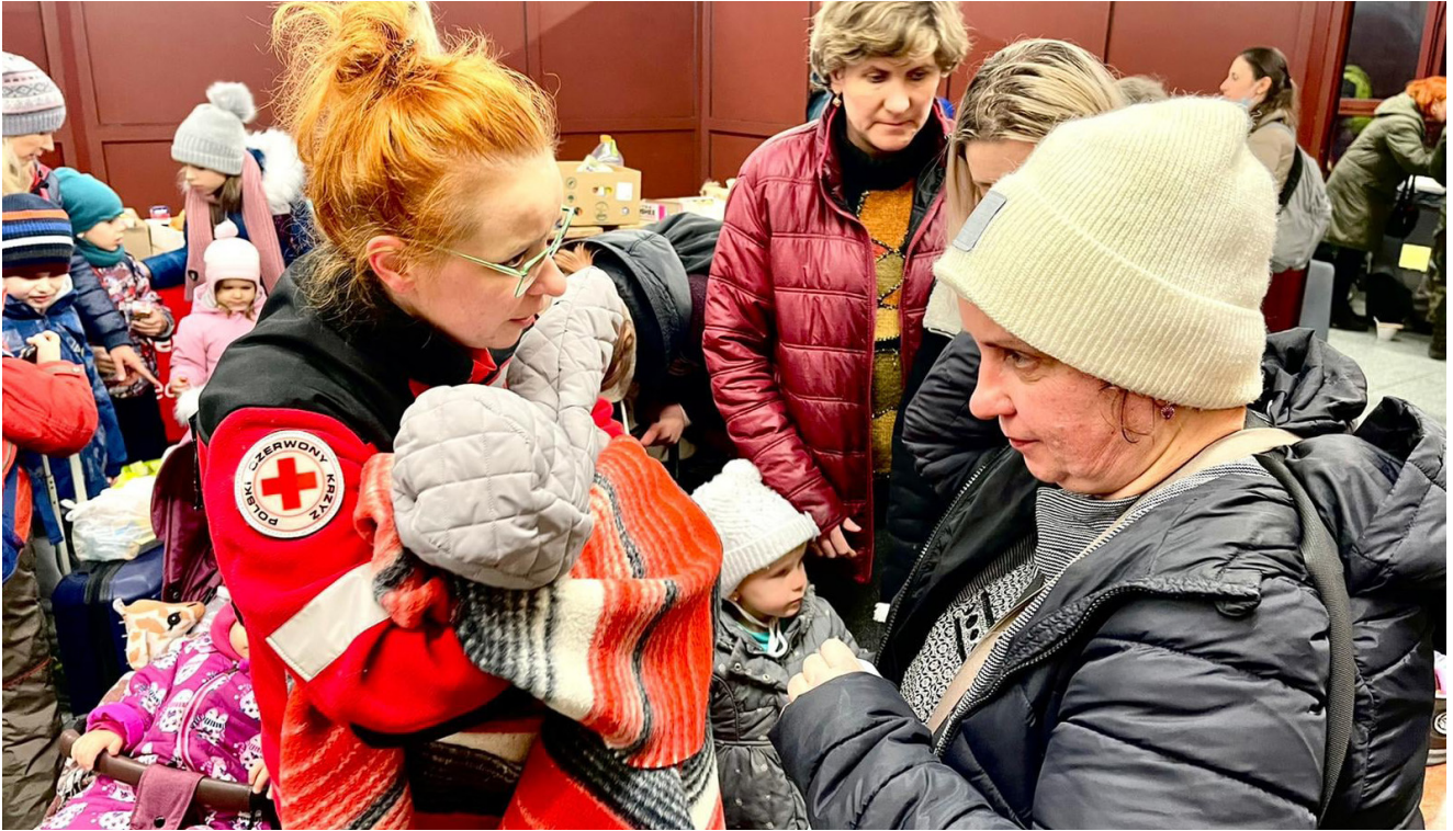
→ Tre dagar efter krigsutbrottet. Kvinnor och barn anländer till järnvägsstationen i Przemysl, Polen.